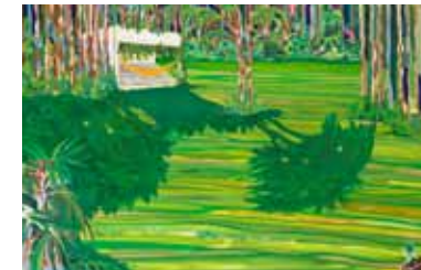
Refúgio , 2010 óleo sobre tela, 100 x 150 cm Galeria Zipper