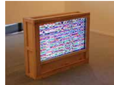
Paisagem Discreta , 2008 madeira, mac Mini, TV LCD de 42" e webcan, 70 x 110 x 30 cm Galeria Zipper

A obra do artista é feita com rigor científico. Mas nem por isso deixa de fazer forte relação com a história da pintura. Muitas cores vibrantes estão aqui representadas. Repare como esse trabalho se comunica com outras obras desta exposição.