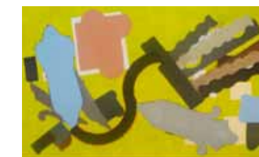
Sem título , 2010 óleo sobre tela, 115 x 188 cm Coleção do artista

Uma exposição que procura refletir sobre os percursos da pintura contemporânea não pode omitir o trabalho de Whitaker. Ele cria diálogo com a produção mais jovem sem deixar de lado a tradição.