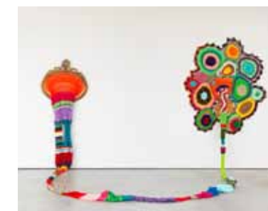
Sem título , 2001 escultura de crochê, 200 x 340 x 175 cm Galeria Zipper

O trabalho da artista ensina: não é apenas pintura o que se constrói por tubos de tinta e se espalha por uma tela por meio de um pincel. A profusão de cores e materiais diferentes também constrói uma pintura.