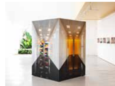
Sem título , 2011 fotografia montada em metacrilato, 200 x 140 x 140 cm edição 1/3 Galeria Zipper

A pintura muitas vezes se comunica com a fotografia. O contrário também acontece. O trabalho de Fialdini compõe um tipo de colagem de imagens, parecido com o ato de pincelar e assim dar forma a uma composição.