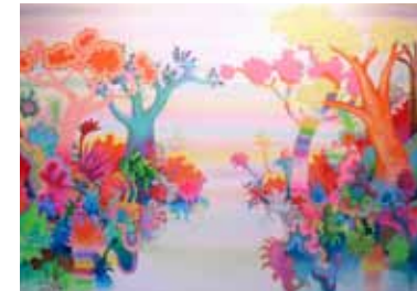
Sem título , 2011 acrílica e caneta pigmentada (Pitt) sobre tela, 150 x 210 cm Galeria Zipper

O artista explora antigas técnicas sem abdicar da franca ligação com a pintura contemporânea. A obra selecionada para a exibição traduz os caminhos da arte fiel a tinta e ao pincel.