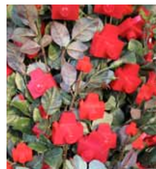
Torre de Rosas Fotográficas , 2011 materiais sintéticos e inorgânicos, 300 x 50 x 50 cm Galeria Zipper

Vemos aqui uma escultura, mas que é também pintura. Ela ganha o aspecto tridimensional e nos faz mergulhar em cenários de cores e formas tantas vezes encontradas nas pinturas densamente pintadas e repintadas.