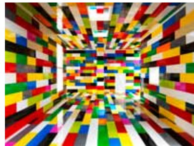
Sem título , 2011 fotografia montada em metacrilato, 160 x 220 cm edição 1/5 Galeria Zipper

A pintura muitas vezes se comunica com a fotografia. O contrário também acontece. O trabalho de Fialdini compõe um tipo de colagem de imagens, parecido com o ato de pincelar e assim dar forma a uma composição.