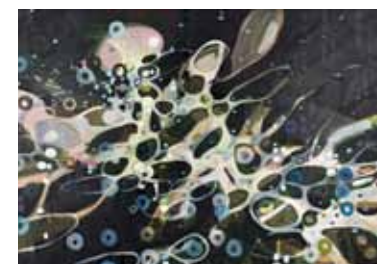
B Flat , 2007 óleo sobre tela, 200 x 300 cm Galeria Fortes Vilaça

Janaina domina o ato de pintar. Mas a pintura não a domina. Essa constatação não é mero jogo de palavras. Ela penetra com sua poesia visual num universo de cores e formas. Um novo mundo se forma para nós.