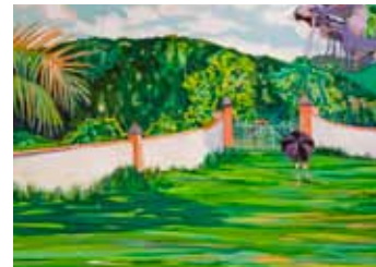
Storm Ahead , 2010 óleo sobre tela, 100 x 140 cm Galeria Zipper

A pintura de Alessandra parece de fácil entendimento. Mas ela guarda surpresas. Algo muito comum na arte contemporânea, que nem sempre se mostra escancaradamente.