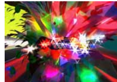
Super ABRAVANA , 2008 vídeo, 6 minutos Casa Triângulo