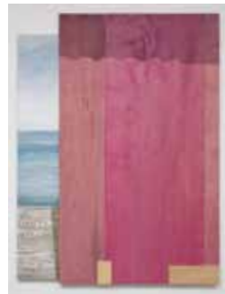
Paisagem Inútil , 2005 acrílica e madeira sobre tela, 220 x 165 cm Galeria Fortes Vilaça

O trabalho de Zerbini reflete sobre um dos temas mais antigos da pintura: a paisagem. Ele usa claramente de ironia. Mas é interessante notar como as cores e formas são elementos essencialmente da tradição da pintura.